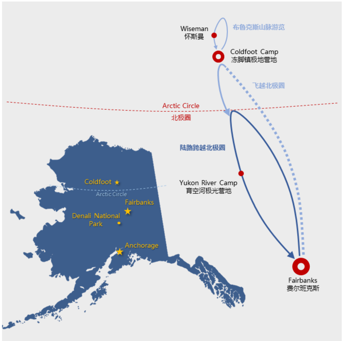
陆路跨越北极圈、飞越北极圈线路示意图