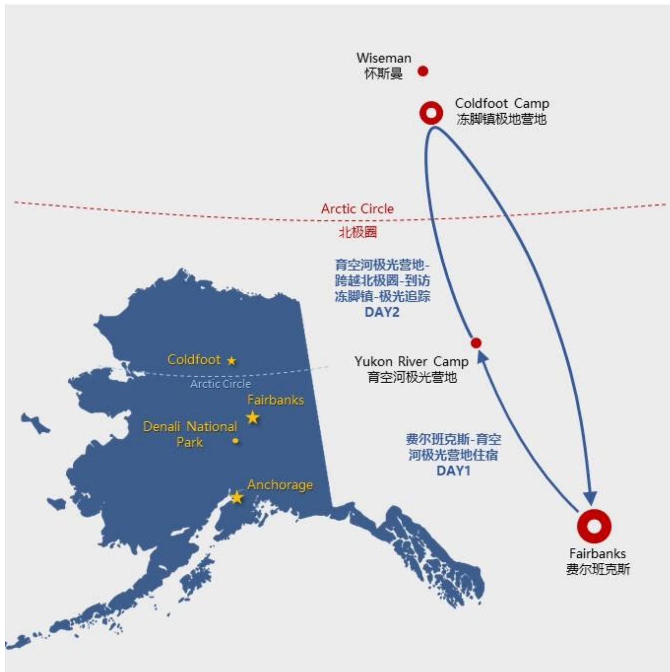
北纬 66°育空河极光营地住宿 2 天 1 晚之旅示意图